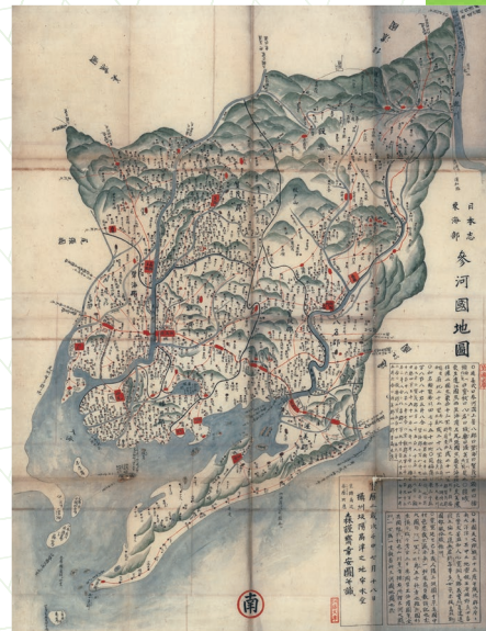
日本志東海部 三河国地図(西尾市岩瀬文庫蔵)