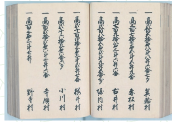
重要文化財 天保三河国郷帳(国立公文書館蔵)

こうした今日の都道府県地図に相当する一国単位の国絵図は、その時々の作製契機を色濃く反映したものになっています。本展では本館新収蔵の三河国絵図を中心に、多彩な絵図を読み解き、その魅力に迫っていきます。