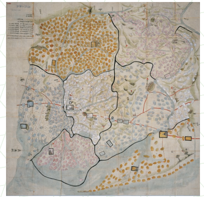
正保三河国絵図(名古屋市蓬左文庫蔵)