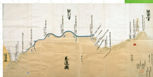
三河美濃国境縁絵図(愛知県図書館蔵)