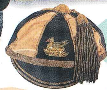
ナショナルチームの一員としてテストマッチを戦った選手に与えられるキャップ