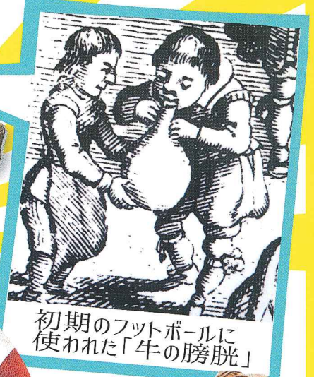
初期のフットボールに使われた「牛の膀胱」