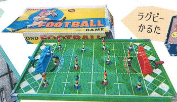
サッカーともラグビーともつかぬ日本製卓上ゲーム