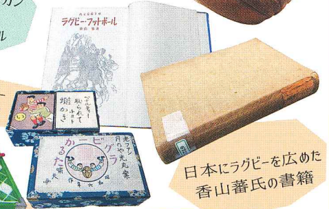
日本にラグビーを広めた香山蕃氏の書籍