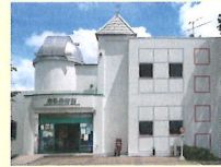
さらめき館 げんき館の隣です！