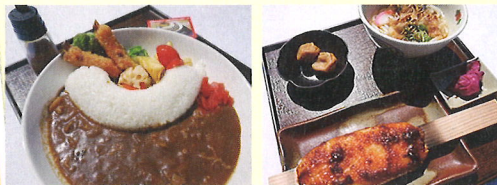
※写真はイメージです。メニュー内容が変更になる場合があります。