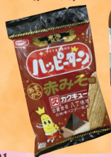
ハッピーターン あまから 赤みそ味