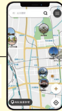
※画面はイメージです