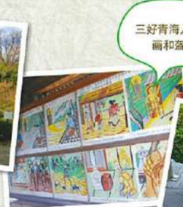
三好青海入道的 画和盔甲