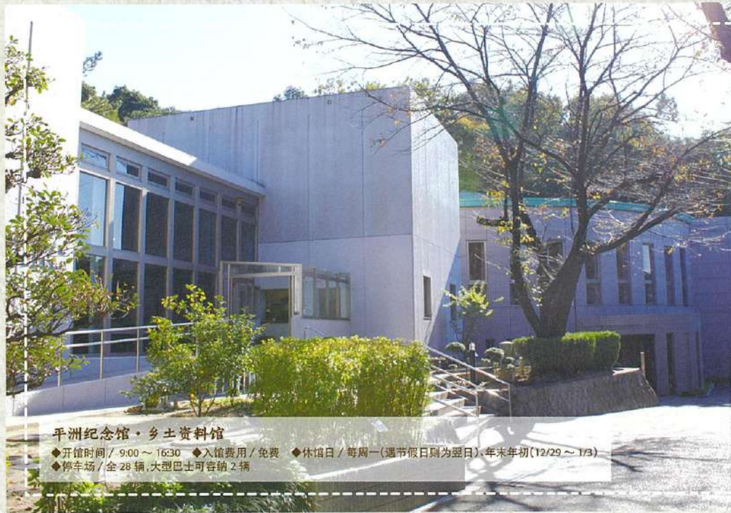
平洲纪念馆・乡土资料馆

馆内有展示平洲亲笔书画的“平洲纪念馆展示室”，信息台上有“平洲大厅”及起名于平洲在江户所开私塾的讲堂“嚶鸣馆”等资料，是一座可切身体会平洲先生之教诲的纪念馆。其书画中的名言释义有的即便在现代也仍然适用，定会感动您的心灵。